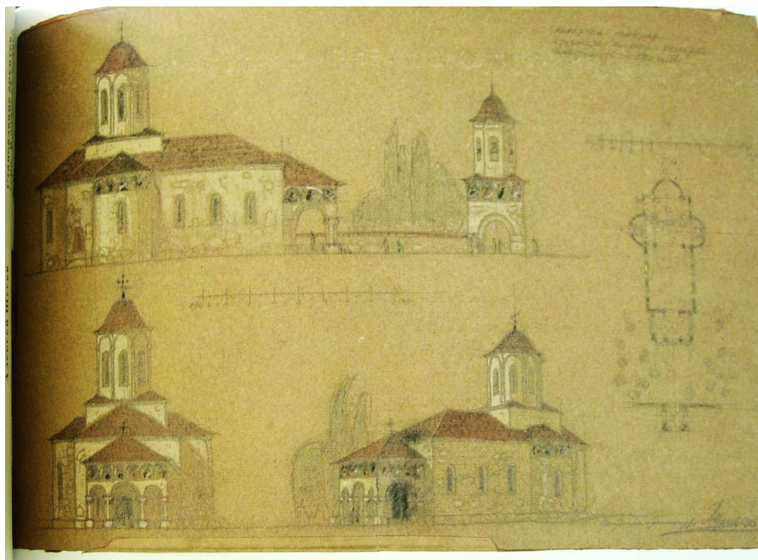
Рис. 3. Фасады, план, перспектива церкви в с. Верхние Кугурешты. 1912 г. Архитектор А.В. Щусев (П.В. Щусев, Страницы из жизни академика А.В. Щусева , с. 81.